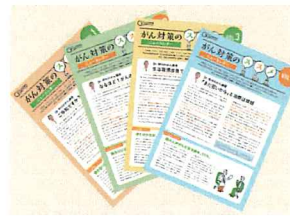
毎月最新の情報をNewsとしてお届け