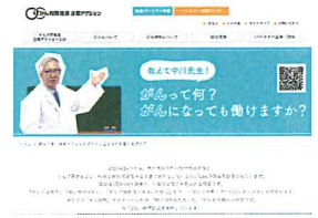
YouTubeでも議長の中川先生が講義