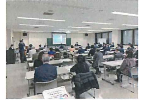
特別講師によるオンライン・オフライン無料研修