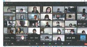
企業同士の情報交換オンライン会議の様子