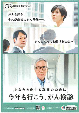
社内掲出用のポスターを無料でプレゼント

無料でも、ここまでできる会社のがん対策！ 「がん対策推進企業アクション」に登録しましょう。